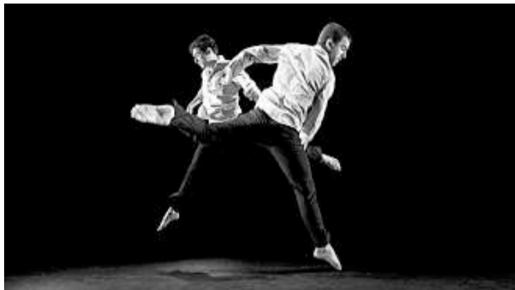
Kukai taldeak Hnuy Illa lanaren zati bat emango du.